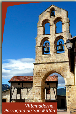
Villamaderne. Parroquia de San Millán