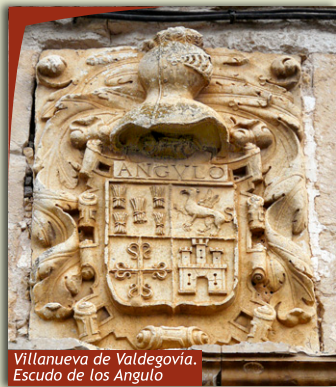
Villanueva de Valdegovia. Escudo de los Angulo