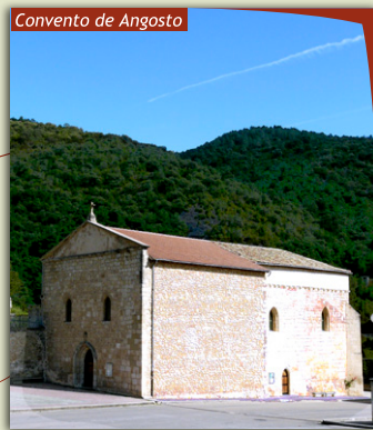
Convento de Angosto