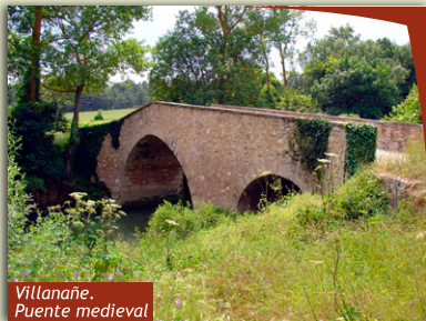
Villanañe. Puente medieval